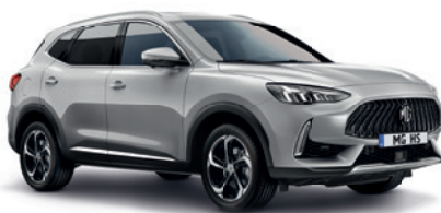
Srebrny „Medal Silver” (metalik)