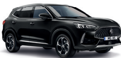
Czarny „Pebble Black” (metalik)