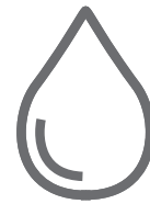
Zużycie paliwa 7,4-7,7 l/100 km