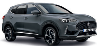
Szary „Magic Grey” (metalik)

Wybierz wariant wyposażenia: Standard, Excite, Exclusive, i przyciągaj spojrzenia, gdziekolwiek pojedziesz.