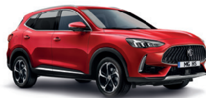
Czerwony „Phantom Red” (trójwarstwowy)