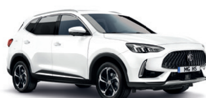
Biały „Dover White” (standard)