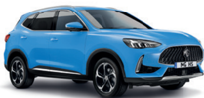
Niebieski „Brighton Blue” (standard)