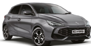
SZARY HAMPSTEAD* Lakier metaliczny