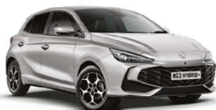
SREBRNY COSMIC* Lakier metaliczny