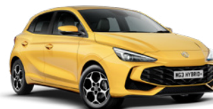
ŻÓŁTY „PASTEL YELLOW” (standard)

* Lakier trójwarstwowy i metaliczny dostępne za dodatkową opłatą.