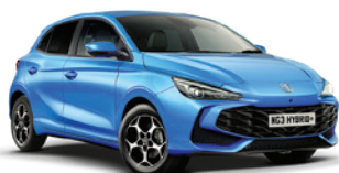
NIEBIESKI „COMO BLUE” (metalik)

Przygotuj się na to, że będziesz przyciągać uwagę.