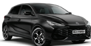
CZARNY „PEBBLE BLACK” (metalik)