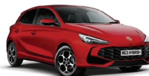
CZERWONY „DIAMOND RED” (trójwarstwowy)