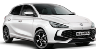
BIAŁY „DOVER WHITE” (standard)