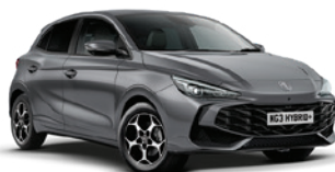
SZARY „HAMPSTEAD GREY” (metalik)